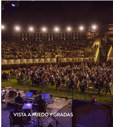
VISTA A RUEDO Y GRADAS