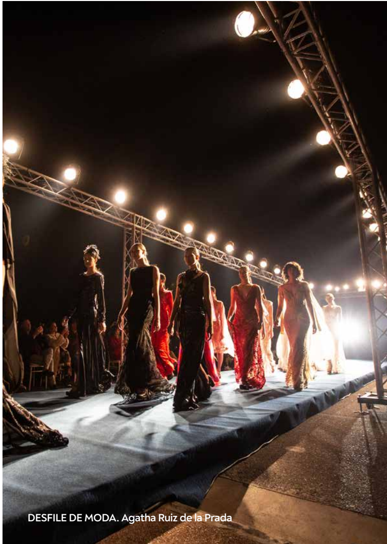
DESFILE DE MODA. Agatha Ruíz de la Prada