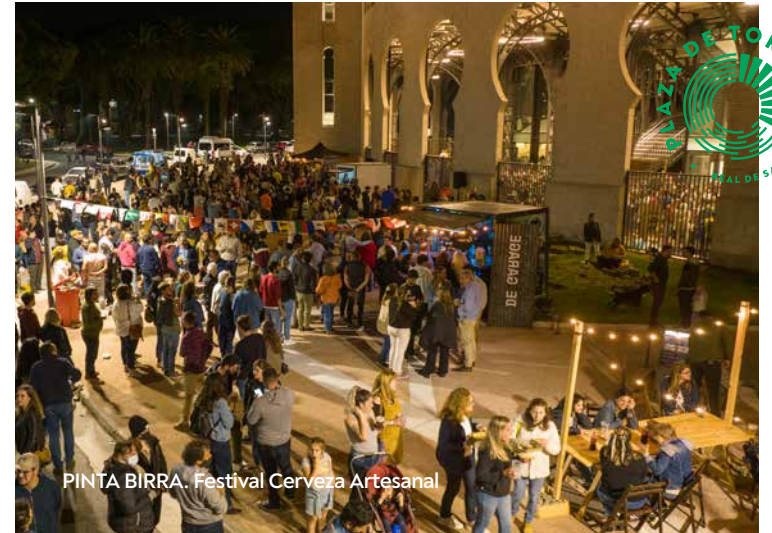
PINTA BIRRA. Festival Cerveza Artesanal