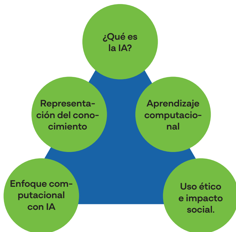
Dimensiones del marco referencial para la enseñanza de la IA.

Las dimensiones son temas, conceptos o ideas poderosas que sirven para diseñar e implementar propuestas pedagógicas. Se relacionan de forma directa con las competencias promovidas para avanzar en el proceso de alfabetización en IA (Kim et al. , 2021; Long y Magerko, 2020; Ng et al. , 2021; Olari y Romeike, 2021; Sentance y Waite, 2002).